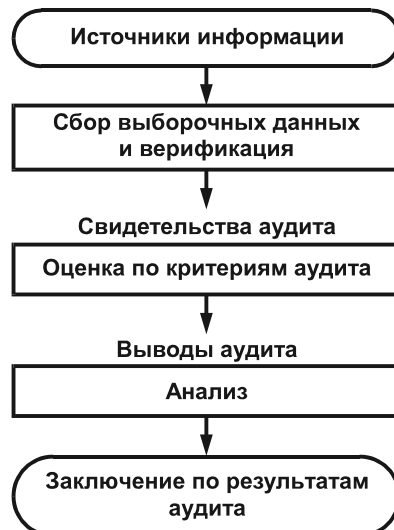
Рисунок 3 — Блок-схема процесса — от сбора информации до получения заключений по результатам аудита

На рисунке 3 приведена блок-схема процесса, начиная от сбора информации до получения заключения по результатам аудита.