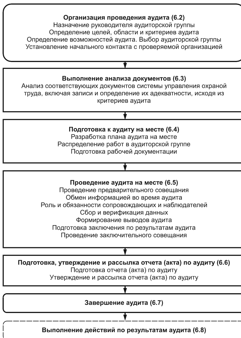
Рисунок 2 — Типовая схема проведения аудита

Примечание — Пунктирные линии указывают на то, что действия по результатам аудита не являются частью аудита.